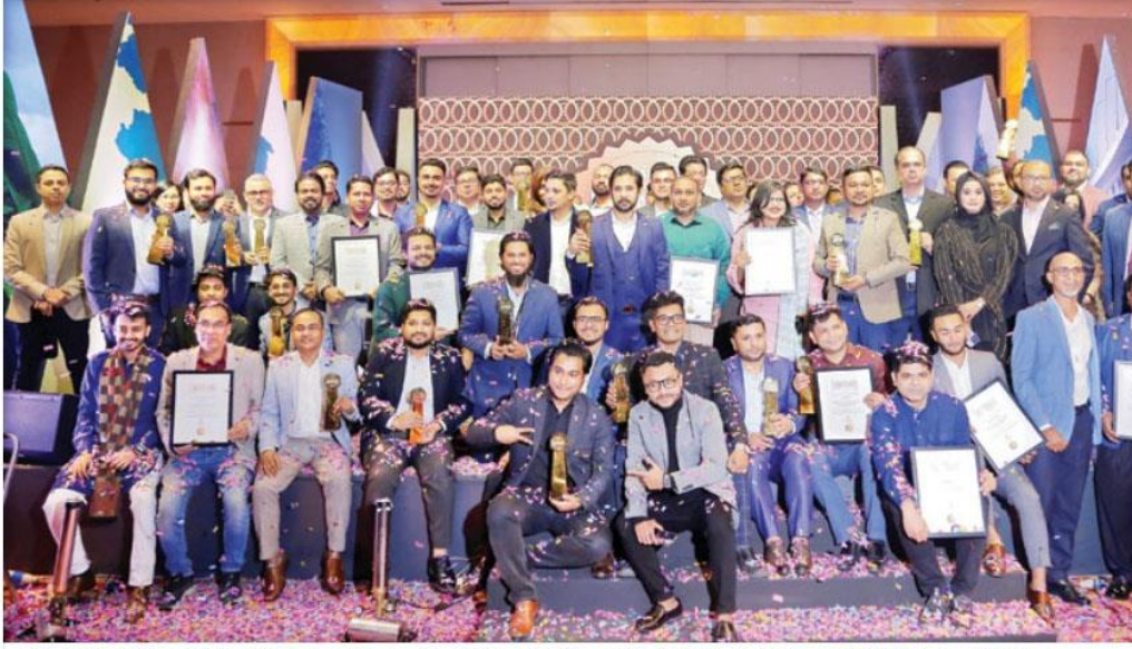
শনিবার রাজধানীর একটি হোটেলে আয়োজিত অনুষ্ঠানে সুপারব্র্যান্ড হিসেবে স্বীকৃতি পাওয়া প্রতিষ্ঠানের প্রতিনিধিরা

আগামী দুই বছরের জন্য সুপারব্র্যান্ড হিসেবে স্বীকৃতি পেল দেশের ৪০টি প্রতিষ্ঠান। শনিবার রাজধানীর একটি হোটেলে আয়োজিত অনুষ্ঠানে প্রতিষ্ঠানগুলোকে বাংলাদেশের সুপারব্র্যান্ড ঘোষণা করা হয়। সেই সঙ্গে প্রতিষ্ঠানগুলোকে নিয়ে একটি প্রকাশনার প্রচলিত উন্মোচন করা হয়। গতকাল এক সংবাদ বিজ্ঞপ্তিতে এ তথ্য জানানো হয়।