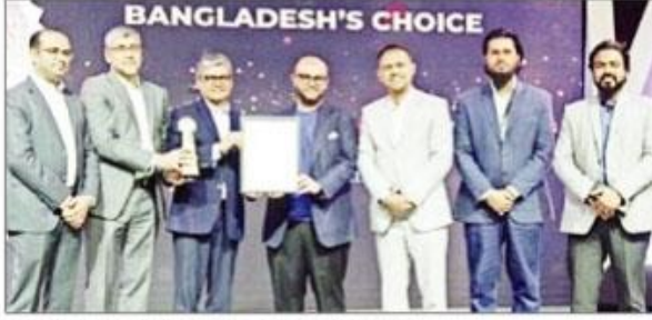
সুপারব্র্যান্ডস অ্যাওয়ার্ড গ্রহণ করছে বসুন্ধরা গ্রুপের একটি প্রাভ