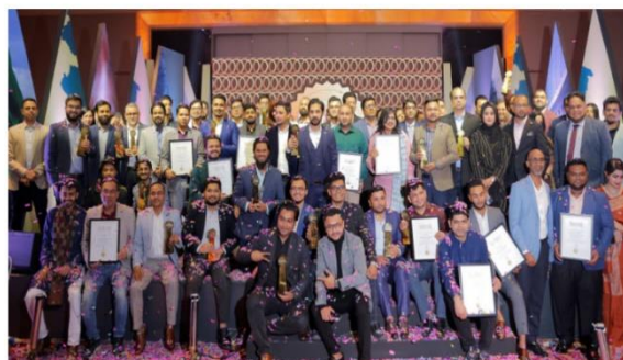
Superbrands Bangladesh representatives pose for a photo at the grand award ceremony at the Grand Ballroom of Sheraton Dhaka recently.

Superbrands Bangladesh has revealed 40 most prestigious and valuable brands for the year 2023-24 through a grand award ceremony at the Grand Ballroom of Sheraton Dhaka, said a press release.