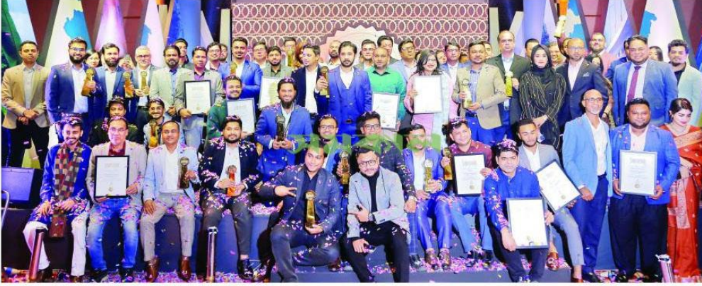
শনিবার রাজধানীর একটি হোটেলে আয়োজিত অনুষ্ঠানে সুপারব্র্যান্ড হিসেবে স্বীকৃতি পাওয়া প্রতিষ্ঠানের প্রতিনিধিরা