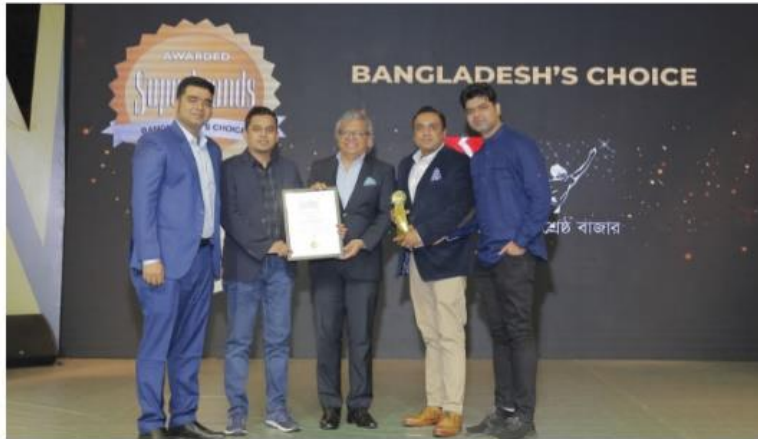
Shwapno officials pose for a photo holding Superbrand award recently in Dhaka.

Shwapno has been honored once again as Superbrands Bangladesh at a formal ceremony at the Sheraton Hotel in Dhaka on February 11.