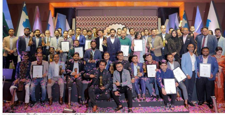
সুপারব্র্যান্ডস স্বীকৃতি পেলো দেশের ৪০ প্রতিষ্ঠান

দেশের ৪০ টি প্রতিষ্ঠানকে আগামী দুই বছরের জন্য সুপারব্র্যান্ডস বাংলাদেশ স্বীকৃতি দেওয়া হয়েছে।