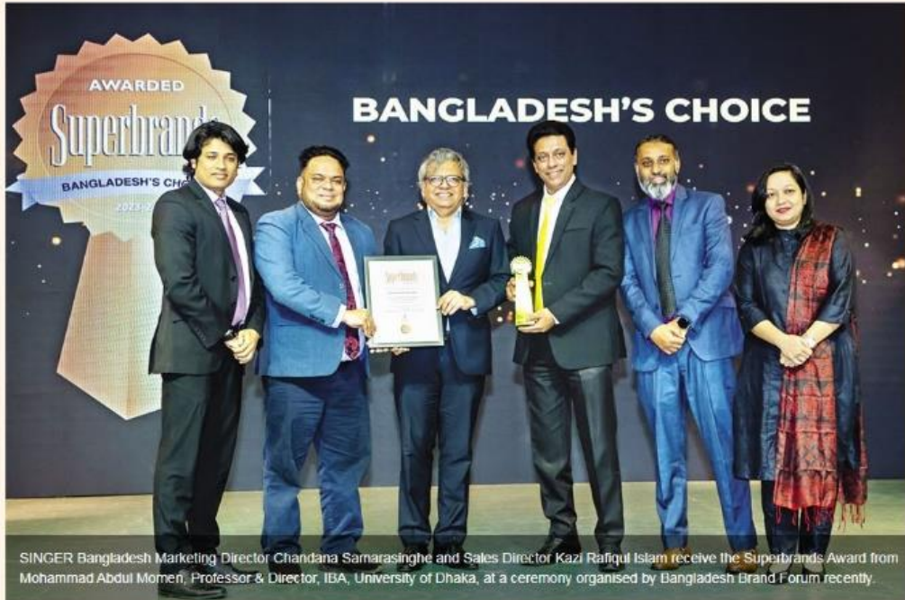
Singer Washing Machine won the Superbrands Award for the session 2023-2024.

Superbrands, an international organisation operating in 90 countries, recognises the brands that deliver both quality products and services to its consumers over a period of time and builds trust in the minds of its consumers.