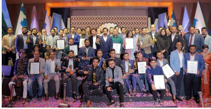
সুপারব্র্যান্ডস প্রকাশনার প্রচ্ছদ উন্মোচন

দেশের ৪০ টি প্রতিষ্ঠানকে আগামী দুই বছরের জন্য সুপারব্র্যান্ডস বাংলাদেশ স্বীকৃতি দেওয়া হয়েছে। ঢাকার শেরাটন হোটেলে অনুষ্ঠিত এক জমকালো অনুষ্ঠানের মাধ্যমে ২০২৩-২০২৪ সালের জন্য বাংলাদেশের সুপারব্র্যান্ড সমূহের নাম ঘোষণা করা হয়েছে। অনুষ্ঠানটিতে একইসঙ্গে আগামী দুই বছরের জন্য সুপারব্র্যান্ডস প্রকাশনার প্রচ্ছদ উন্মোচন করা হয়েছে।