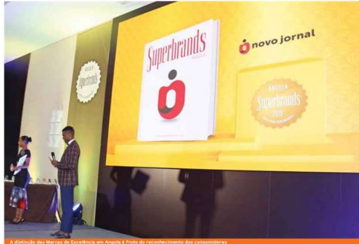
A distinção das Marcas de Excelência em Angola é fruto do reconhecimento dos consumidores